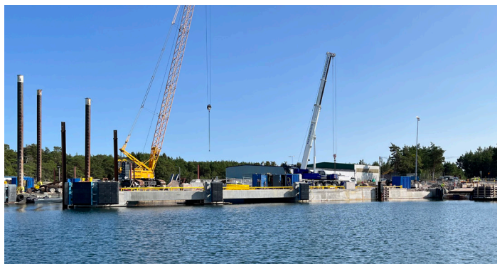
Arbetet med det nya färjefästet pågår för fullt.

Under tiden som arbetet med den nya klaffen pågår kommer trafiken att ledas om, till ett tillfälligt färjefäste.