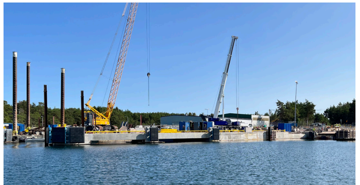
Arbetet med det nya färjefästet pågår för fullt.

Under tiden som arbetet med den nya klaffen pågår kommer trafiken att ledas om, till ett tillfälligt färjefäste.